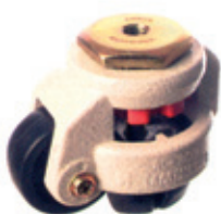
SLC-300S - Bolzenmontage