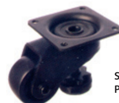
SLC-50PL - Plattenmontage