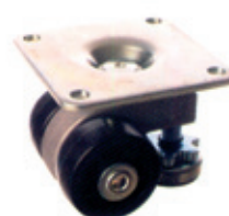
SLC-400PL - Plattenmontage