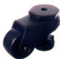
SLC-200SL - Bolzenmontage